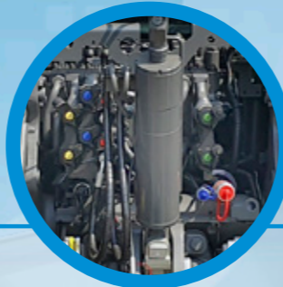
Winkelsensor an der Deichsel Angular sensor on the drawbar